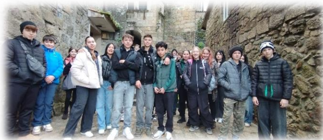
Jak se vyučuje a žije ve Švédsku měli možnost zjistit naši žáci na historicky první mobilitě v rámci projektu Erasmus+