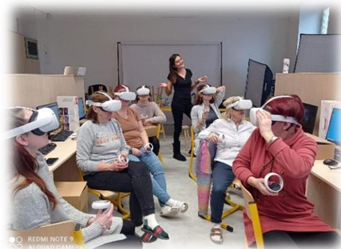
Ostrčilka učí moderně díky financím z NPO