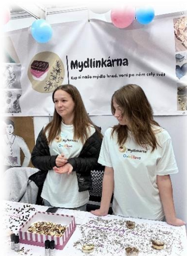
Druhý ročník Veletrhu příležitostí fiktivních firem pro nadané žáky