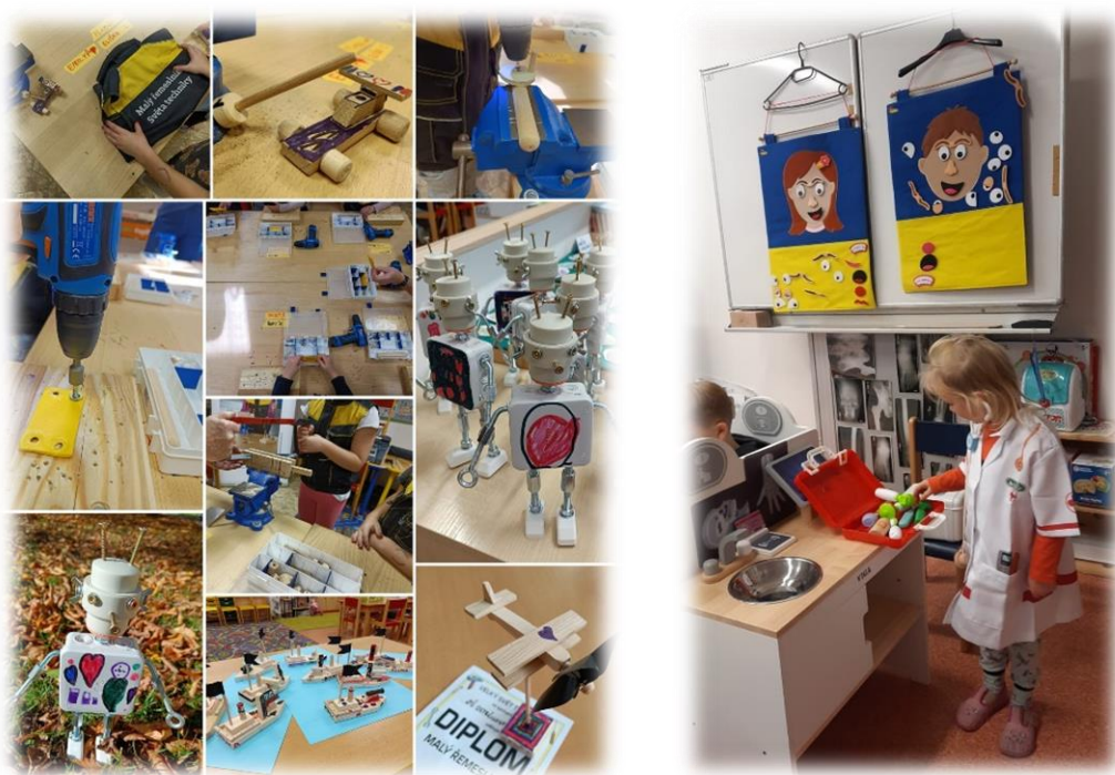
Fotografie z projektových dnů financovaných z finančních prostředků MOaP v mateřské škole v roce 2023