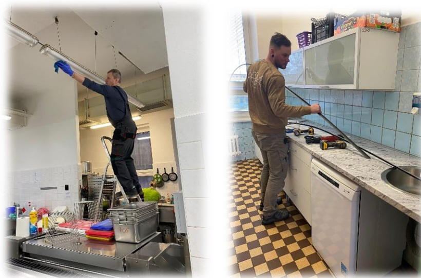
Opravujeme, udržujeme, modernizujeme...