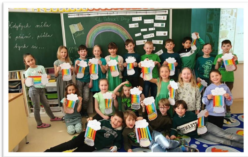
St Patrick's Day

A snad neprozrazuji příliš dopředu: naši rodičí mluvčí opět připravují letní příměstský tábor. Bližší informace naleznete na konci tohoto čísla.