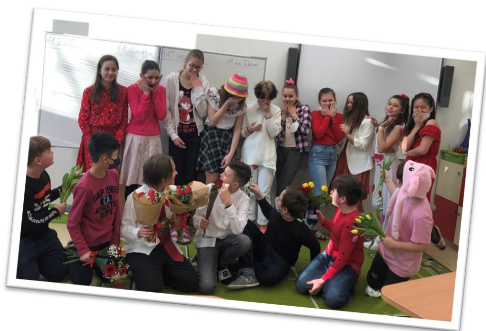
Na svatého Valentýna se v 6.E2 i kytice předávaly...

živočichů oblasti Beskyd, zajímavosti byly předávány interaktivní formou, kdy si mohli ohmatat skutečné exponáty. Druhá část probíhala ve venkovních prostorách, kde děti v potůčku lovili drobné živočichy, které následně pozorovali pomocí zvětšovací skel a určovali jeho druh a název.