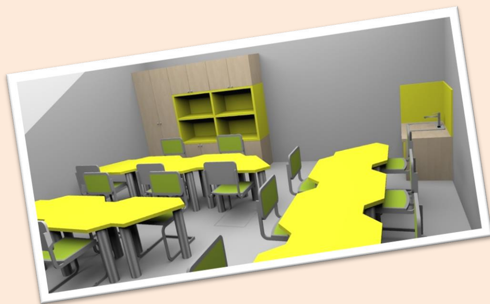
Vizualizace budoucího badatelského koutku

Na nové prostory se těšíme všichni, ale nejvíce asi učitelé z kabinetů fyziky a chemie, kteří získají nové, moderní zázemí ve svých kabinetech.