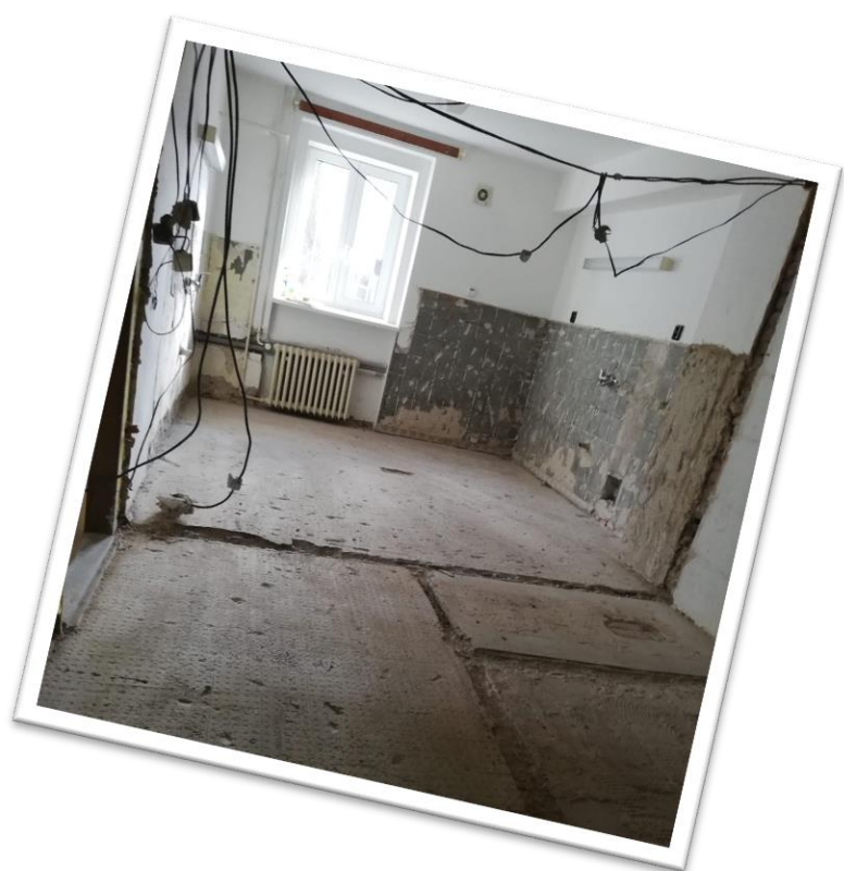
Rekonstrukce odborných učeben v plném proudu! Stav chemie, fyziky a kuchyňky focen v druhé polovině února.

Druhý projekt si naše organizace realizuje sama. Jedná se o projekt ENVIRONMENTÁLNÍ CENTRUM - RADOST Z POZNÁNÍ A BADATELSKÝ KOUTEK je spolufinancován Evropskou unií. Projekt řeší modernizaci dvou učeben odpovídající současnému vývoji a moderním vzdělávacím metodám pro zájmové a neformální vzdělávání. Modernizované učebny umožní rozšíření moderních forem vzdělávání v návaznosti na klíčové kompetence přírodní vědy a práce s digi. technologiemi.