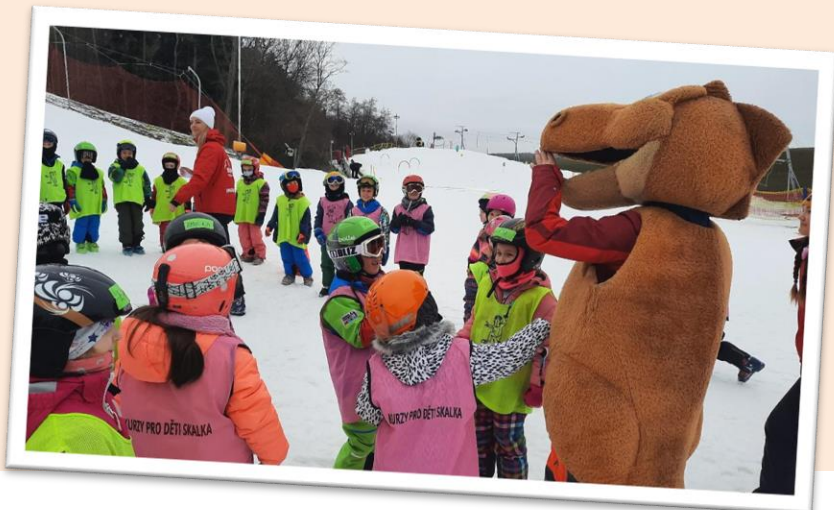
Lyžování na Skalce

konci duhy.... a pro pár příštích dní nechceme vidět zelenou barvu... ..zatímco 14. února byla všude v bilingvních třídách růžová. Kdo by neznal svátek sv. Valentýna? Ale naši žáci už také vědí, proč se slaví, kdo byl svatý Valentýn a vyzkoušeli si, někteří poprvé, napsat „valentýnku“.