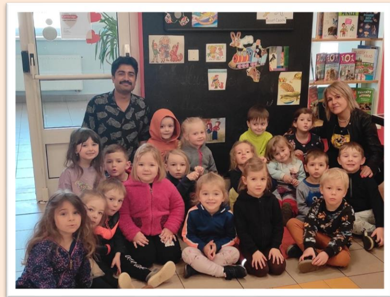
„Poprvé ve velké škole....návštěva dětí z naší MŠ“

18. března jsem se účastnil celodenního výletu do Zážitekového centra URSUS v Dolní Lomné. Děti byly seznámeny s množstvím